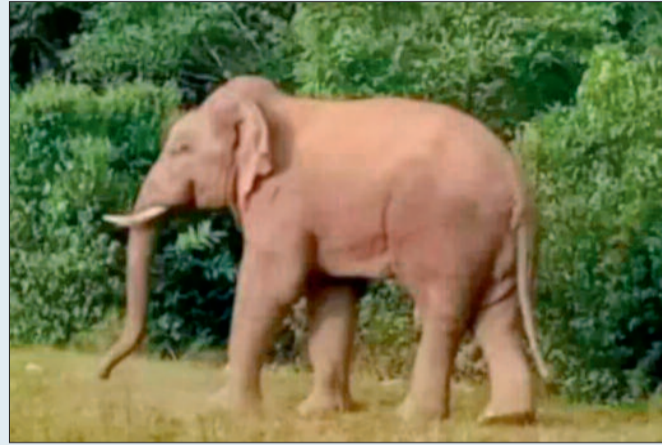
के लिए रुकते हैं और फिर आगे बढ़ जाते हैं। लेकिन इस बार झुंड से बिछड़ा यह हाथी जिले के भीतर काफी गहराई तक पहुंच चुका है। ऐसे में उसकी सुरक्षित निगरानी, संभावित मार्गदर्शन और ग्रामीणों की सुरक्षा सुनिश्चित करना वन विभाग के लिए एक बड़ी चुनौती बन गया है।

सफर तय कर मोरमदेव अभ्यारण तक पहुंच गया है। इस दौरान कई बार हाथी गांवों और खेतों के नजदीक नजर आया, जिससे ग्रामीणों में दहशत फैल गई है। लोग रात के समय खेतों और जंगल की